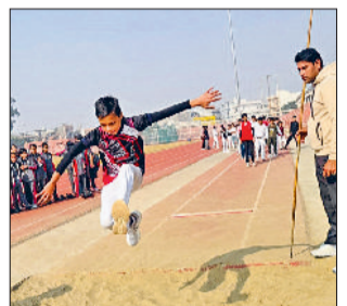
गोहाणा। लंबी कूद में अपनी खेल प्रतिभा का प्रदर्शन करते हुए विद्यार्थी।