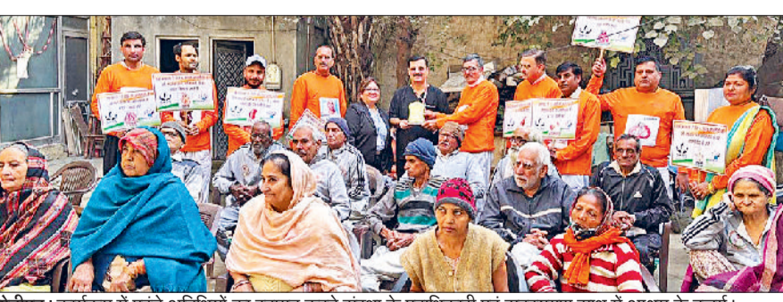
सोनीपत। कार्यक्रम में पहुंचे अतिथियों का स्वागत करते संस्था के पदाधिकारी एवं सदस्यगण साथ में आश्रम के बुजुर्ग।