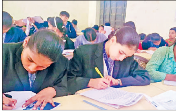
गोहाणा। निबंध लेखन और पेंटिंग प्रतियोगिताओं में भाग लेते हुए विद्यार्थी।

प्रधानमन्त्री पोषण शक्ति निर्माण योजना को और प्रभावी बनाने के लिए मौलिक शिक्षा विभाग हरियाणा और संयुक्त राष्ट्र खाद्य कार्यक्रम के मध्य सहमति के सन्दर्भ में विभिन्न विद्यालयों में 6-6 विद्यार्थियों ने खंड स्तरीय कार्यक्रम में भाग लिया