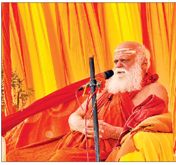
सोनीपत। धर्म सभा के दौरान प्रवचन करते हुए शंकराचार्य स्वामी निश्चलानंद सरस्वती महाराज।

श्री गोवर्धन मठ पुरी के पीठाधीश्वर शंकराचार्य स्वामी निश्चलानंद सरस्वती महाराज ने अपने प्रवचन में अर्थ, कर्म, धर्म और मोक्ष जैसे जीवन के चार पुरुषार्थों का गहन विवेचन किया। उन्होंने स्पष्ट किया कि भोग्य सामग्री को 'अर्थ' कहा गया है, क्योंकि मनुष्य का जीवन केवल आध्यात्मिक ही नहीं, बल्कि सांसारिक आवश्यकताओं के संतुलन पर भी आधारित है। उन्होंने कहा कि जीवन का उद्देश्य केवल जीविका कमाना नहीं, बल्कि कर्म और धर्म के मार्ग से होते हुए मोक्ष की दिशा में आगे बढ़ना है। जन्म और मृत्यु को उन्होंने जीवन की दो निश्चित अवस्थाएं बताते हुए कहा कि जो इस सत्य को समझ लेता है, वही जीवन को सही दृष्टि से देख पाता