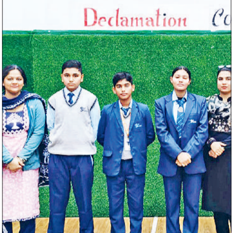
गन्नीर। प्रतियोगिता के विजेता प्रतिभागी छात्र शिक्षकों के साथ।