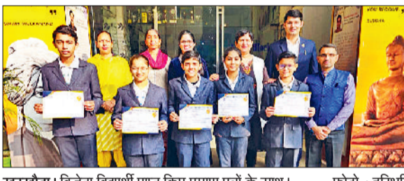
खरखोदा। विजेता विद्यार्थी प्राप्त किए प्रमाण पत्रों के साथ।